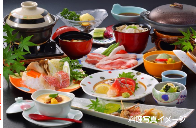
料理写真イメージ

旅行代金 (お一人様・4名以上) 20,800 円 3名1室 希望の場合 お一人様 2,000円増 2名1室 希望の場合 お一人様 4,000円増 相部屋 希望の場合 同料金