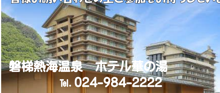
磐梯熱海温泉 ホテル華の湯 Tel. 024-984-2222